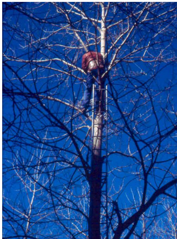
Figura 2. Recolección de estaquillas de P. tremula .

que un gran porcentaje de semillas son estériles. Esta característica es la que hace que tradicionalmente se utilice la multiplicación asexual, vegetativa, de forma común en la popicultura mediterránea y que se basa fundamentalmente en los chopos euroamericanos (Grau, 1991). En general, los chopos se multiplican clonalmente mediante el estaquillado. Las estaquillas de calidad se obtienen, durante el periodo de reposo vegetativo (Fig. 2), de los dos tercios inferiores de brotes del año bien lignificados y son fragmentos de 20-30 cm de longitud y no menos de 8-10 mm de diámetro (González-Antoñanzas y Grau, 1999). Pero la propagación vegetativa por estaquillas es muy desigual de unos chopos a otros; así los álamos temblones no tienen ninguna aptitud para el estaquillado y es esta dificultad de P. tremula en propagarse por estaquilla lo que ha dificultado la clonación convencional de ejemplares selectos, autóctonos y adaptados a los ecosistemas.