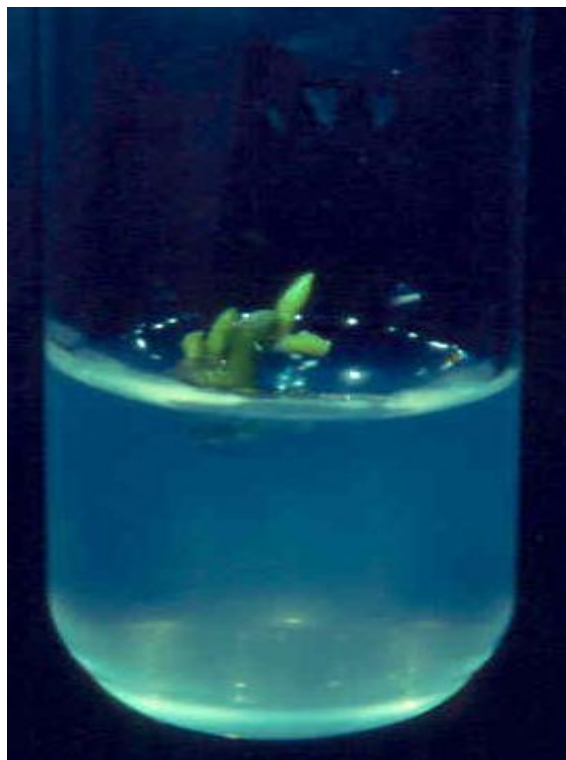
Figura 5. Yemas de P. tremula inducidas sobre segmentos nodales con la citoquinina 6-BAP (6-bencilaminopurina) y la auxina ANA (ácido naftalenacético).