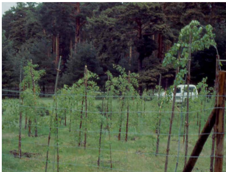
Figura 9. Ejemplares de P. tremula producidos mediante micropropagación trasplantados a parcela en campo dentro de su área natural de distribución.