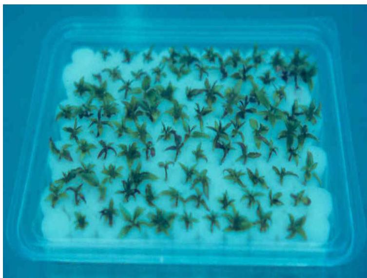
Figura 7. Proceso de enraizamiento de brotes clonales de P. tremula inducido por la auxina IBA (ácido indolbutírico) sobre soportes de filtro.