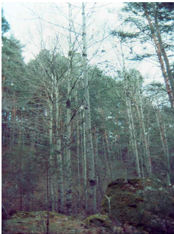
Figura 1. Imagen de Populus tremula L. en reposo vegetativo.

El área de distribución del álamo temblón es muy amplia, desde sus orígenes en las zonas frías del norte de Europa y Asia hasta España y Turquía llegando incluso a Corea del Norte y Japón. En su distribución más al sur ocupa las montañas, creciendo en zonas donde la precipitación excede a la evapotranspiración (von Wühlisch, 2009).