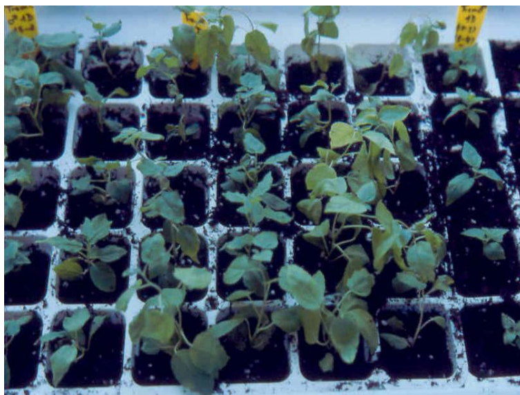
Figura 8. Plantas de P. tremula producidas in vitro creciendo en invernadero para su aclimatación ex vitro .

Las plantas regeneradas in vitro de P. tremula se aclimatan en invernadero con un túnel de niebla, en este túnel de niebla la humedad relativa está próxima al 90%. El sustrato es una mezcla de turba y perlita (1:1) estéril (Fig. 8). Después de dos semanas las plantas se pueden sacar del túnel y trasplantar a un vivero. Lograremos así que la supervivencia en esta fase esté próxima al 96%.