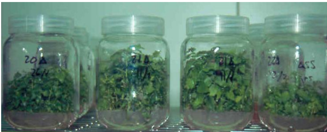
Figura 6. Multiplicación de brotes de P. tremula mediante la acción de la citoquinina 6-BAP (6-bencilaminopurina) y la auxina ANA (ácido naftalenacético).