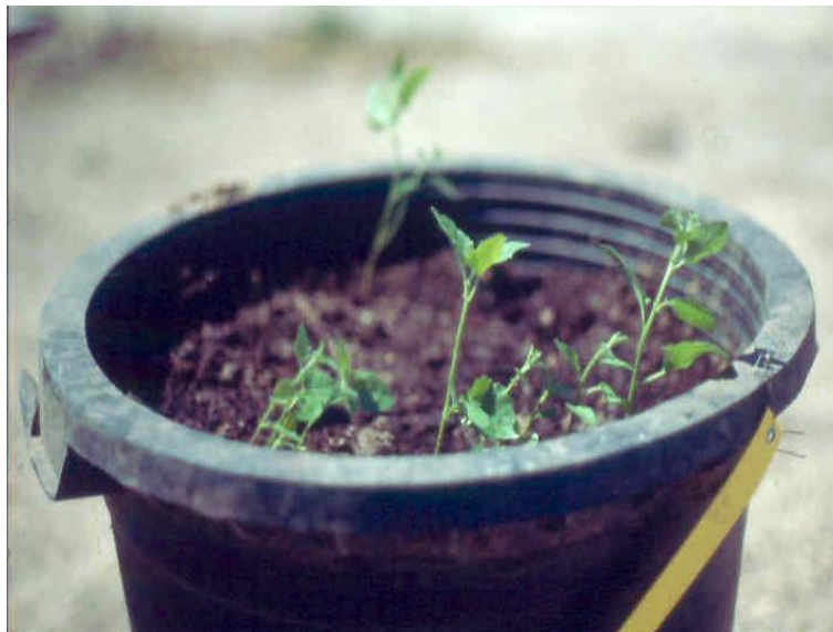
Figura 3. Aparición de brotes de P. tremula sobre turba y perlita (2:1) tras la estimulación de las raíces con la citoquinina 6-BAP (6-bencilaminopurina).

Una vez seleccionados los individuos a propagar se procede a tomar las muestras para iniciar el cultivo. Estas muestras son trozos de raíz de 5-10 cm de grosor que se mantienen en el invernadero en macetas con turba y perlita (2:1). En los fragmentos de raíz se realizan incisiones superficiales que se pulverizan con 6-bencilaminopurina (6-BAP) para estimular la producción de brotes (Fig. 3). El 6-BAP es un regulador de crecimiento, una citoquinina sintética, las citoquininas son fundamentales para la formación de brotes. Entre ellas la 6-bencilaminopurina (6-BAP) es, en general, la citoquinina más efectiva y la más empleada en la inducción de yemas axilares. El tiempo aproximado de elongación de los brotes es de siete semanas.